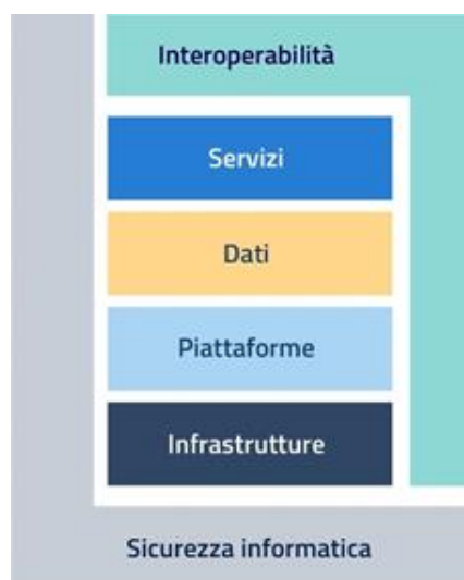
Figura 1 - Modello strategico di evoluzione del sistema informativo della Pubblica Amministrazione

L'aggiornamento 2022-2024 del Piano Triennale mantiene inalterata la struttura del documento consolidata nella scorsa edizione e fa riferimento al Modello strategico di evoluzione ICT della PA, che descrive in maniera funzionale la trasformazione digitale, attraverso: due livelli trasversali relativi a interoperabilità e sicurezza informatica e, quattro livelli verticali per servizi, dati, piattaforme ed infrastrutture.